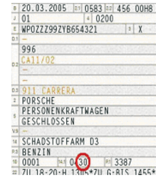
Zulassungsbescheinigung Teil I als 3. und 4. Stelle des 4 stelligen Codes zu Feld 14.1