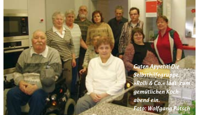
Guten Appetit! Die Selbsthilfegruppe »Rolli & Co.« lädt zum gemütlichen Kochabend ein.

Jeder Mensch ist einzigartig, jeder Mensch verschieden. Deshalb ist es normal, verschieden zu sein. In der Selbsthilfegruppe »Rolli & Co.« treffen sich Menschen mit ganz unterschiedlichen körperlichen Behinderungen. Mit Rolli oder ohne, das spielt hier keine Rolle. Miteinander und voneinander lernen, miteinander sprechen und Spaß haben, gemeinsam einen Teil der Freizeit miteinander verbringen, das sind die Themen der rund 15-köpfigen Selmer Gruppe.