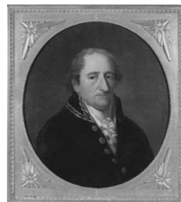
Freiherr vom und zum Stein

1831 Karl Freiherr von und zum Stein, umiera w swojej, obranej na lata starości siedzibie – pałacu Cappenberg w Selm. Ten pruski reformator państwa był m.in. przewodniczącym rządu krajowego Prowincji Westfalskiej i członkiem rad powiatowych w powiatach Hamm (Unna) i Lüdinghausen.