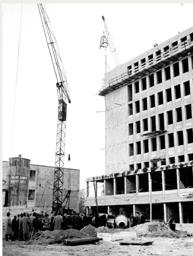
Verwaltungsgebäude im Bau

Erster demokratisch gewählter Landrat wird Hubert Biernat (1946 bis 1950 und nochmals von 1961 bis 1964; Biernat ist u.a. Mitglied der SPD-Fraktion im Nordrhein-Westfälischen Landtag, Innenminister des Landes NRW und zwischenzeitlich auch Regierungspräsident in Arnsberg).