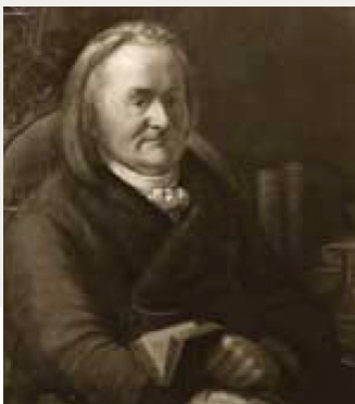
Landrat David Wiethaus

1813 Spitze des Arrondissements Hamm wird 1809 als Unterpräfekt David Wiethaus gestellt.