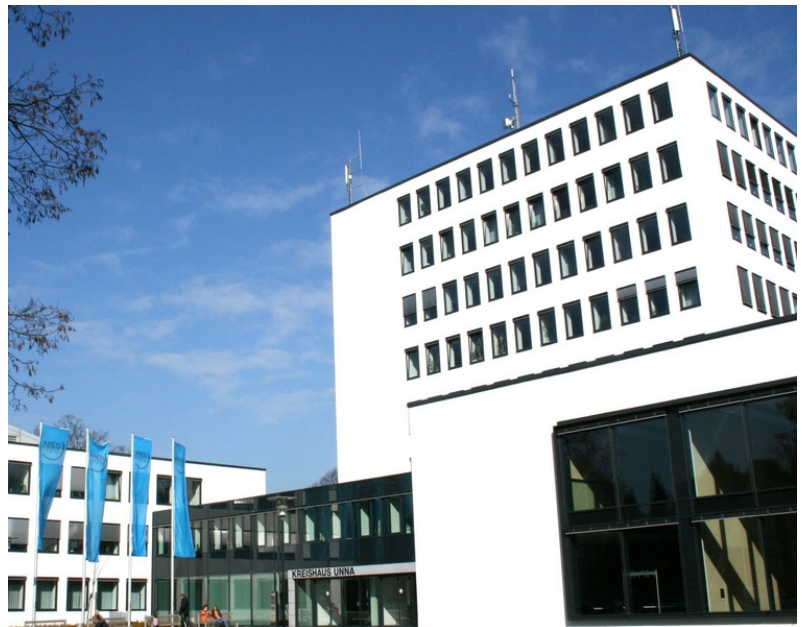
Kreishaus Unna nach der Sanierung

2005 bis 2005 Komplette Sanierung des Verwaltungsgebäudes an der Friedrich-Ebert-Straße in Unna im Rahmen eines bis dato einmaligen PPP-Modells (public-private-partnership).