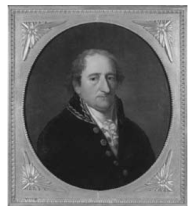
Freiherr vom und zum Stein

1831 Karl Freiherr vom und zum Stein stirbt 73-jährig auf seinem Altersruhesitz Schloss Cappenberg in Selm. Der preußische Staatsreformer war u.a. Vorsitzender des Westfälischen Provinziallandtages und Mitglied in den Kreistagen des Kreises Hamm (Unna) und Lüdinghausen.