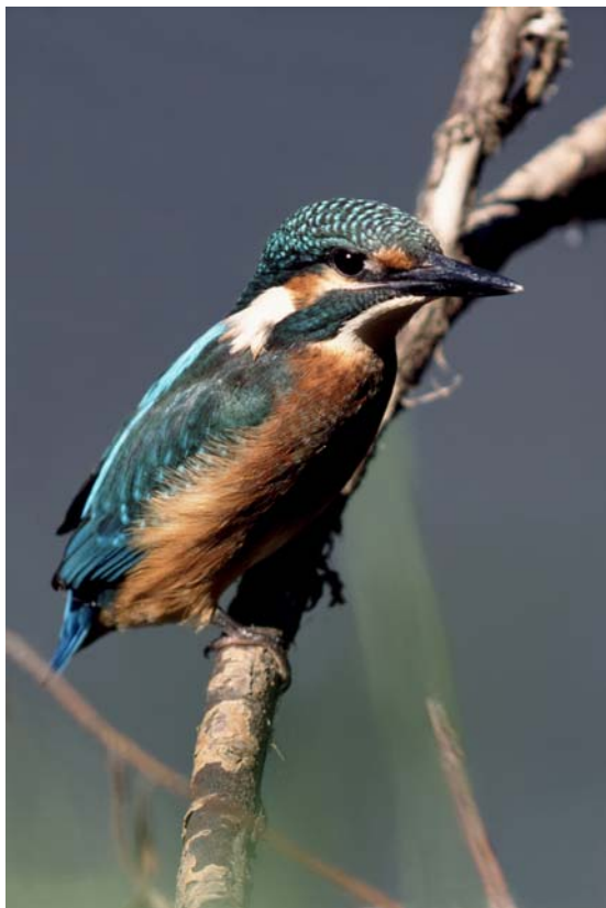
Eisvogel, gerade flügge

In den Naturschutzgebieten in der Lippeaue ist ein besonders rücksichtsvolles und naturschonendes Verhalten notwendig, damit es nicht zu Beeinträchtigungen der Tier- und Pflanzenwelt kommt. Tragen Sie mit Ihrem vorbildlichen Verhalten dazu bei.