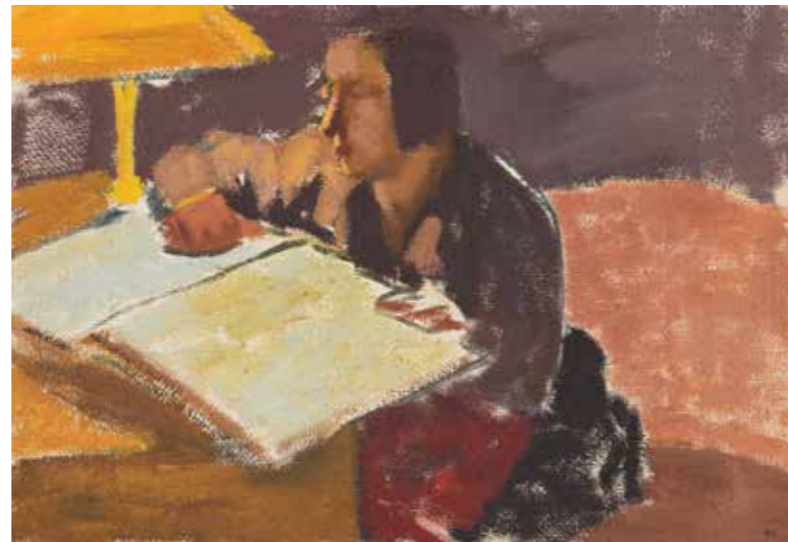
Paul Wieghardt | Die gelbe Lampe | 1929

Konzeption und Durchführung: Alexandra Dolezych. Zeitraum des Schulklassenprogramms: 05.05. – 26.06.2020 jeweils dienstags - freitags 9.45 - 12.15 Uhr. Um telefonische Anmeldung für das Schulklassenprogramm wird gebeten unter Fon 0251 664758.