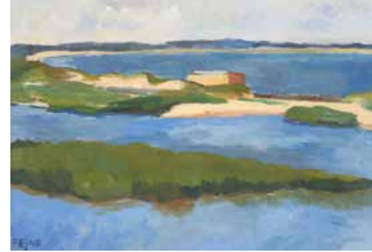
Helga Leiser-Fejne Skälderviken (Küstenlandschaft) 1949

Konzeption und Durchführung: André Siegel. Termin: Donnerstag, 09.04.2020, 11.00 – 13.00 Uhr. Um telefonische Anmeldung an der Museumskasse wird gebeten unter Fon 02301 9183972.