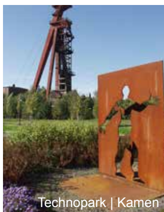
Technopark | Kamen

Zarówno gospodarcza jak i turystyczna przyszłość tego miejsca wyrosła z jego górniczej przeszłości. Na terenach pokopalnianych powstały parki technologiczne , takie jak na przykład w mieście Kamen, nawiasem mówiąc jest to geograficzne centrum powiatu Unna, czy Lünen. Tutaj, międzynarodowej sławy architekt Luigi Colani stworzył tzw. Colani-Ufo ; z architektonicznego punktu widzenia bardzo pomysłową nasadkę na wieży wyciągowej. Oprócz wspomnianego wyżej parku powstały także inne nowe np. rezerwat przyrody Beversee.