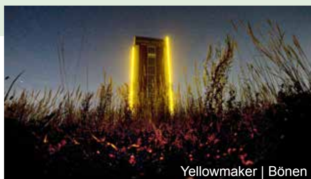
Yellowmaker | Bönen

Gmina Bönen jaśnieje zawsze w godzinach wieczornych dzięki tzw. Yellowmarker . To dzieło rozświetla wieżę kopalni Königsborn III/IV i wyznacza wschodni biegun na wspomnianej wyżej trasie Industriekultur.