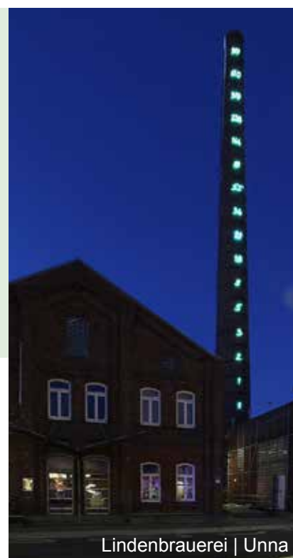
Lindenbrauerei | Unna