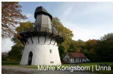
Mühle Königsborn | Unna