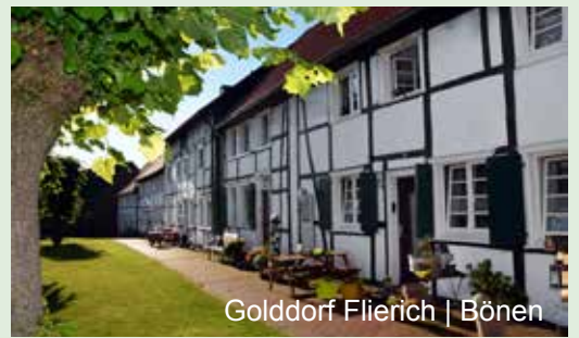
Golddorf Flierich | Bönen