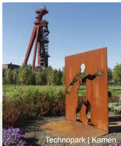
Technopark | Kamen

“direct in de buurt”. Tegelijkertijd wordt het landschap aan Lippe en Ruhr, tussen Münsterland en Sauerland als onverbruikt ontspanningsgebied belicht. De economische en toeristische toekomst vloeit voort uit de mijnbouwgeschiedenis. Op mijnterreinen ontstaan technologieparken zoals bijvoorbeeld in de stad Kamen – overigens het geografische centrum van het district Unna – of in Lünen. Daar ontwierp de internationaal bekende designer Luigi Colani een architectonisch uitgekiend opzetstuk op een schachttoren – het “ Colani-UFO ”. Er ontstaan echter ook nieuwe landschapsgebieden, zoals bijvoorbeeld in Bergkamen rondom de steenberg “ Großes Holz ” en het natuurreserveaat Beversee .