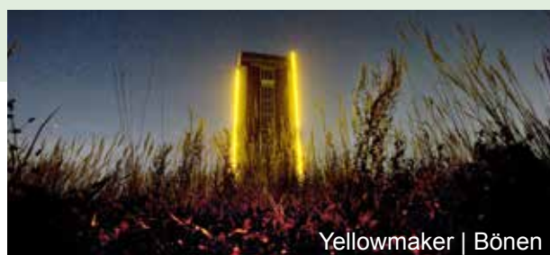
Yellowmaker | Bönen

De Lindenbrauerei in Unna is zelfs ankerplaats op de “Route der Industriekultur” en zet met het “Zentrum für Internationale Lichtkunst” in de oude brouwerijgewelven een kunst-accent van supraregionaal belang. De gemeente Bönen straalt ondertussen in de avondstond met haar “ Yellowmarker ”. Het kunstwerk plaatst de schachttoren van de mijn Königsborn III/IV optisch in het middelpunt en kenmerkt als “oostpool” de “Route der Industriekultur”. Veelzeggende getuigenissen van de kettingsmeedkunst voor mijnbouw en scheepvaart bevinden zich in het “ Kettenschmiedemuseum ” in Fröndenberg.