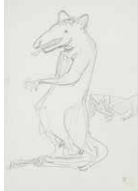
Ratte | ohne Jahr Bleistift auf Papier | 32 x 22,2 cm, Sammlung Friedrich Graf Luckner

05.08.2022, 10.30 – 13.00 Uhr, kostenlos