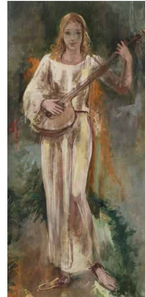
Muse der Musik | 1938

Soweit nicht anders gekennzeichnet, sind die Veranstaltungen des Rahmenprogrammes im Eintrittspreis inbegriffen.