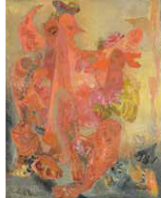
Proteus – Gestalt zu wechseln bleibt noch deine Lust (Thalus) | 1963 Öl auf Leinwand | 100 x 80 cm Sammlung Graf von Kanitz

Anmeldung unter kunst.p.mecklenbrauck@t-online.de