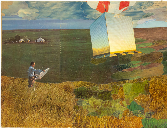
Nils-Ole Lund | Die Zukunft der Architektur | um 1976/1981 Deutsches Architekturmuseum, Frankfurt am Main

Freitag, 20.03.2026 & Freitag, 19.06.2026