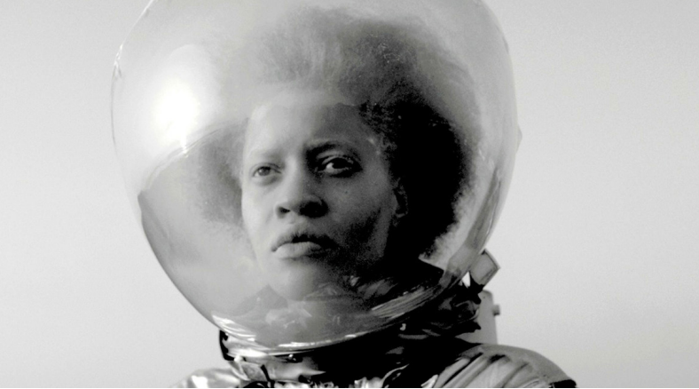
Nuotama Bodomo | Afronauts | 2014 | Leihgabe der Künstlerin Standbild aus Afronauts , Joshua James Richards