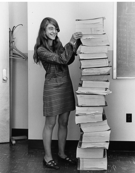
Margaret H. Hamilton with Apollo computer software | 1969

Wie kann technologischer Fortschritt zu Selbstermächtigung führen? Was macht zukünftige Körper wohl aus und wer darf sie gestalten?