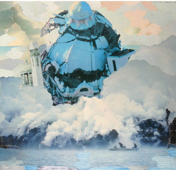
Nils-Ole Lund | The dawn of the dome um 1976/1981 | Deutsches Architekturmuseum, Frankfurt am Main Foto: Uwe Dettmar | © Nachkommen von Nils-Ole Lund / VG Bild-Kunst, Bonn 2026

Die Führung eröffnet einen kritischen Blick auf die futuristische Idee von Fortschritt und lädt dazu ein, ihre Aktualität im Kontext heutiger technologischer und gesellschaftlicher Entwicklungen neu zu reflektieren.