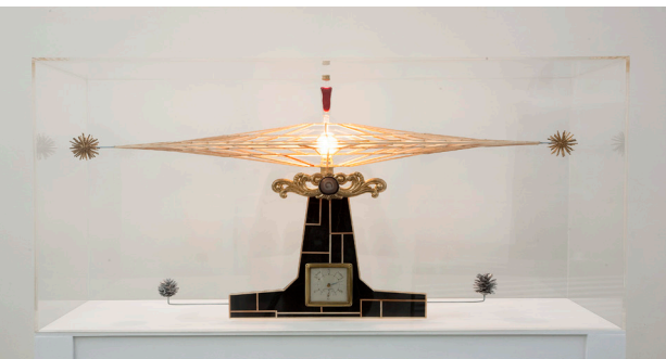
Björn Dahlem | Galaxie | 2010 Sammlung Philara, Düsseldorf

Eine ganz andere Sicht auf das Weltall verfolgt Björn Dahlem. Aus alltäglichen Materialien entstehen Installationen, die sich auf naturwissenschaftliche Fragen rund um den Kosmos beziehen. In der Veranstaltung geht es um die Auseinandersetzung mit Raumfahrt und kosmologischen Vorstellungen aus afrikanischer und europäischer sowie aus männlicher und weiblicher Perspektive am Beispiel der Werke der beiden Künstler*innen.