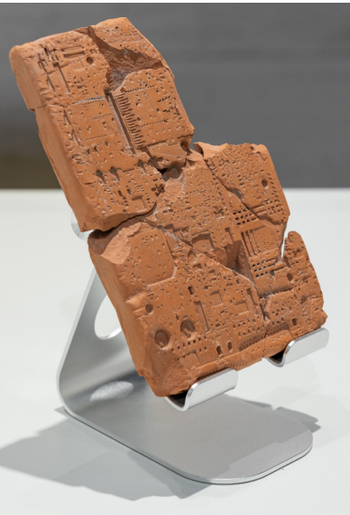
Nicolás Lamas | Letters to the future | 2024 Max Godelitz, München/Berlin